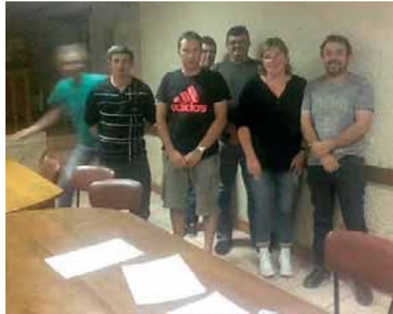
► Les adhérents de la cuma de Prudhomat, réunis en juillet pour un projet d'achat d'épandeur à fumier.

béjou Noix, à Saint-Michel Loubéjou, au nord du département, aura officiellement cessé d'exister... Pour renaître, d'une certaine façon, au sein de la cuma voisine de Prudhomat.