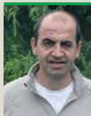
► Président de la fdcuma du Lot

Revue éditée par la SCIC Entraid, SA au capital de 45280€. RCS : B 333 352 888. ISSN 1165 418X - Cppap 1219T85749 - Impression Capitouls, 31 Balma Siège social 73, rue de Saint-Brieuc, CS 56520, 35065 Rennes cx. © 0299546312 - Siège administratif © 0562191888 Président-directeur général et directeur de la publication Luc Vermeulen Directeur général délégué Jérôme Monteil Directeur de la rédaction Pierre Criado Directeur de la publicité Emmanuel Aldeguer © 06 08 42 35 88 <e.aldeguer@entraid.com> Responsable d'édition Elise Poudevigne Ont participé à la rédaction : Jean-Marie Constans, Natalie Hugon, Clément Boggia. Studio de fabrication D. Bucheron, I. Mayer, Marie-J. Milan, C. Tresin, M. Masson © 0562191888 Promotion-Abonnement Francis Cescato © 06 07 22 57 29, Jennifer Bramardi, Bénédicte Bousquet, Marina Fabre © 0562191888. Abonnement 1 an : 62,50€ - Tarif au N° : 8€ Toute reproduction interdite sans autorisation et mention d'origine.