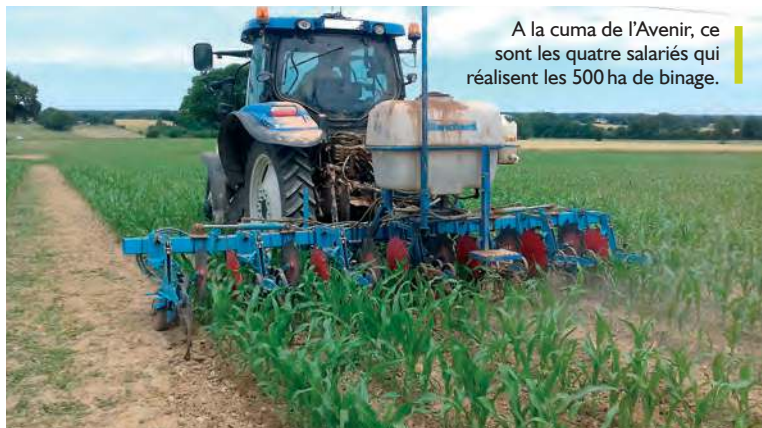
A la cuma de l'Avenir, ce sont les quatre salariés qui réalisent les 500 ha de binage.

La cuma de la Guierche (72) possède deux enrubanneuses, une mono-balle et une continue, qui fonctionnent bien. Les besoins de main-d'œuvre importants qu'engendrent ces chantiers et la croissance d'activité avec la recherche d'autonomie protéique et fourragère de la part des élevages adhérents, ont amené la cuma à s'adapter. En 2015, une demande de subvention PCAE est déposée pour une presse-enrubanneuse. Ce projet de création d'activité répond aux attentes des adhérents, mais il y a toujours un risque d'échec. Pour sécuriser son projet, la cuma a loué un tracteur et une presse-enrubanneuse à un concessionnaire. Le résultat est au rendez-vous. Le tarif proposé, le service en prestation complète et l'activité séduisent les adhérents. La cuma concrétise en 2016 son projet, par la livraison d'une presse McHale Fusion 3. L'investissement a représenté 85 000 €. Après 3 années, les responsables de la cuma se félicitent de la réussite du projet. L'activité est au rendez-vous, avec 7 243 bottes réalisées en 2017 et 4 500 en 2018. La botte est facturée 8,60 €. C'est aussi une activité agréable pour les salariés qui ont réalisé 510 heures en 2018 (conduite, entretien, déplacement) sur cet ensemble récent et confortable. ■ Mathieu Heurbize