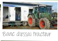
Banc d'essai tracteur