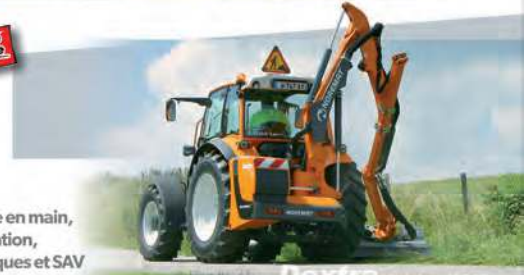
Dextra Visioobra M5-11

* Montage, prise en main, conseils, formation, visites périodiques et SAV par un technicien usine NOREMAT