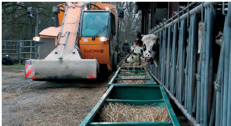
A Bouloire, cinq élevages ont privilégié la désileuse automotrice commune : une solution satisfaisante.