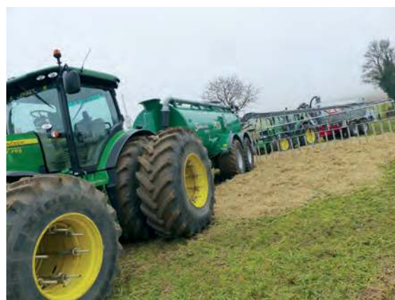
À la cuma de Villemoron, les coûts d'épandage globaux varient de 4 à 6 €/m 3 .