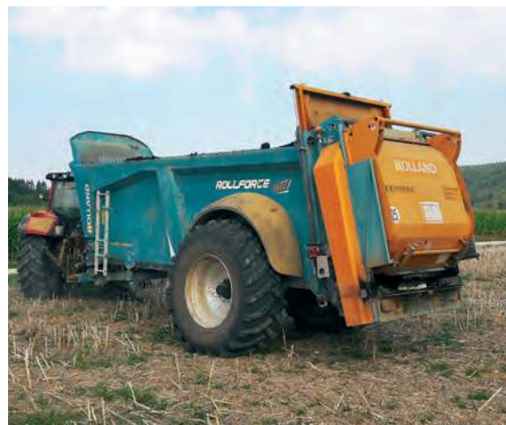
La cuma de Villesec épand environ 4000 tonnes de digestat solide par an.

Dans les deux ans à venir, environ 15 projets vont voir le jour et plu-