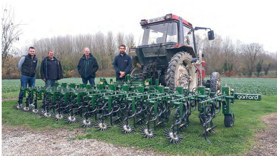
La bineuse Garford de la cuma de Bréban.

Propos recueillis par Guillaume Saint Ellier