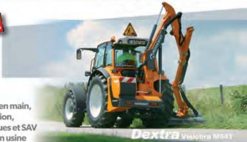
Dextra Valotra M5-11

* Montage, prise en main, conseils, formation, visites périodiques et SAV par un technicien usine NOREMAT