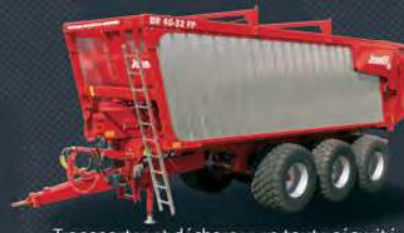
Transporter et décharger en toute sécurité