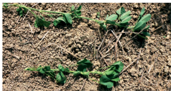
Les types « nord » ont des indices de dormance élevés, et les types « sud » des périodes de dormance plus courtes.