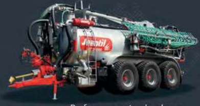
Performance et polyvalence

Rue de la Tertrais - Z.I. De la Hautière - CS 29007 - 35590 L'HERMITAGE Tél. : 02 99 64 04 04 - Fax : 02 99 64 19 56 - e-mail : jeantil@jeantil.com