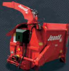
L'efficacité dans tous les produits