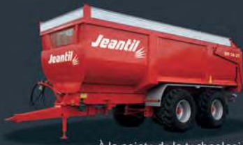
À la pointe de la technologie