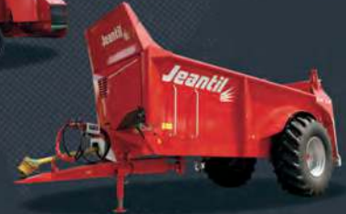
Précision et régularité certifiées