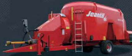
La distribution de précision