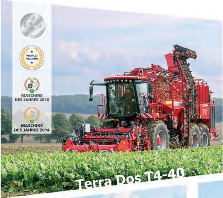
Terra Dos T4-40