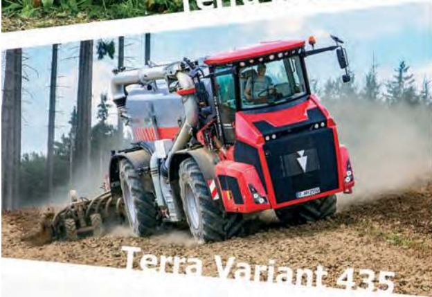
Terra Variant 435