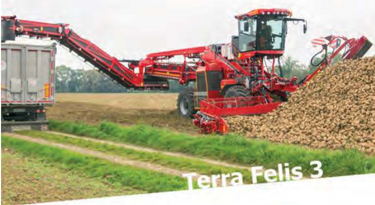
Terra Felis 3