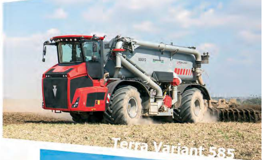
Terra Variant 585