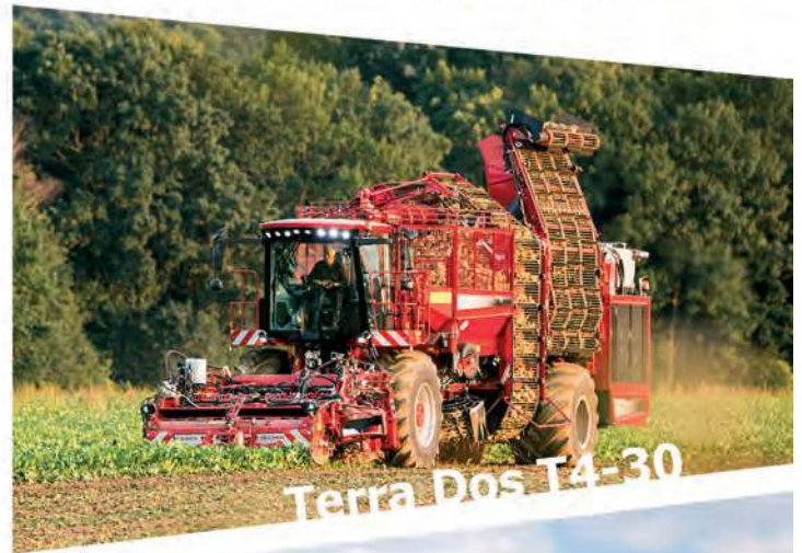
Terra Dos T4-30