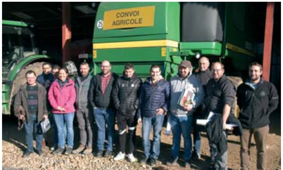
Le groupe de participants composé de plusieurs représentants de cuma qui emploient des salariés.