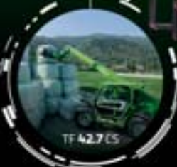
TF 42.7 CS