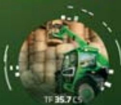
TF 35.7 CS

Pour plus d'informations info@merlo-france.fr 01 30 49 43 60