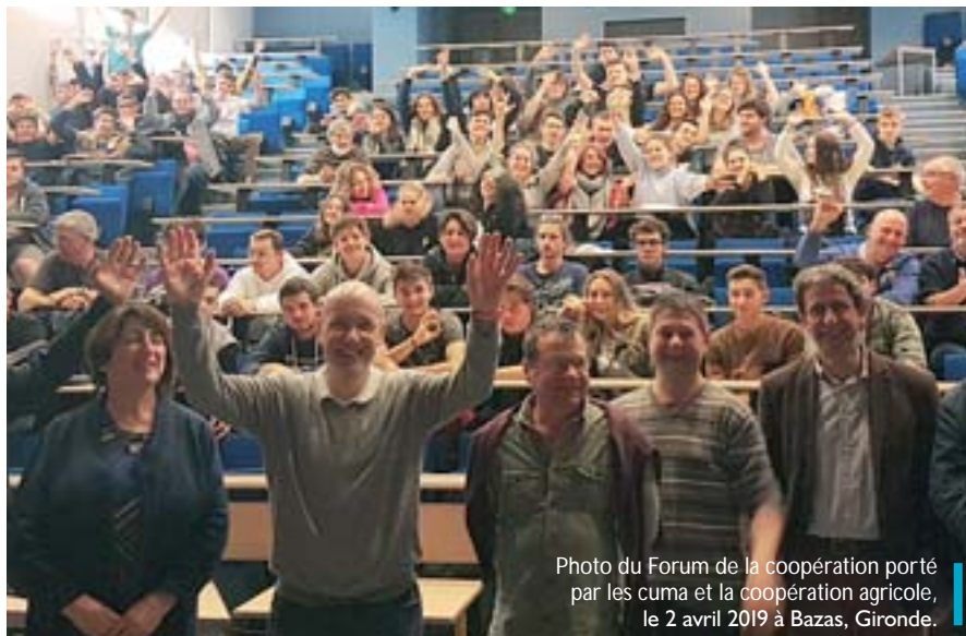
Photo du Forum de la coopération porté par les cuma et la coopération agricole, le 2 avril 2019 à Bazas, Gironde.

(*) Direction régionale des Entreprises, de la Concurrence, de la Consommation, du Travail et de l'Emploi