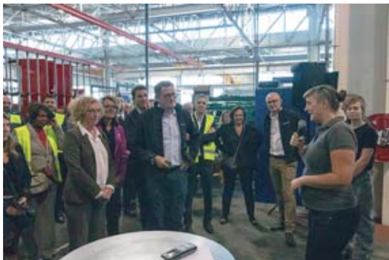
La ministre du travail, Muriel Pénicaud, venue découvrir à l'usine de Châteaubourg le dispositif « Réussir l'industrie », en octobre 2018.