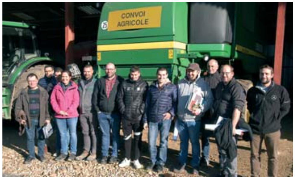
Le groupe de participants composé de plusieurs représentants de cuma qui emploient des salariés.